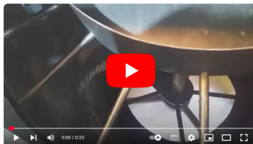
FRESA HELICOIDAL MAQUINA DE HIELO EN ESCAMAS POLAIR 5000 KG/24Hs. MODELO SCA-5000

El cilindro formador es una cámara de doble pared de acero inoxidable rectificado y en su interior circula el gas refrigerante. La fresa también de acero inoxidable de máxima precisión desprende las plaquetas de hielo. Por tratarse de un sistema continuo de cosecha constante, no necesita descongelamientos ni tiempo de parada , por lo que tiene el máximo rendimiento por KW consumido y una excelente relación producción / costo de inversión.